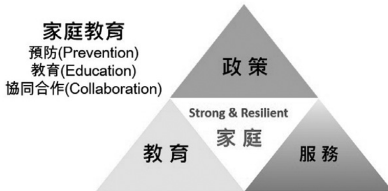
圖3 支持家庭的金三角：政策、服務與教育